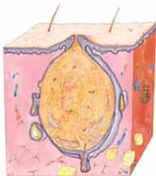
TILSTOPPET / HVID HUDORM

Billederne nedenfor viser to slags hudorme, en åben og en lukket. På næste side viser billederne, hvordan hudormen først har udviklet sig til en bums og derefter en byld. Ikke alle hudorme udvikler sig til bumser, men så længe, der eksisterer en forøget produktion af talg og hudceller, er der risiko for dannelse af nye hudorme og bumser. De fleste bumser går i sig selv, men de der bliver hårde og går dybt ned, kan skabe varige ar.