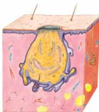
ÅBEN / SORT HUDORM

Er knap synlig men ses som små knopper på huden.